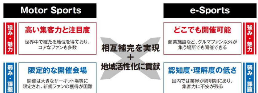
JeGT開催による両業界の相互補完構図

また、会場を限定せずに行うことができるため、 開催地域の賑わいづくりにも貢献 します。